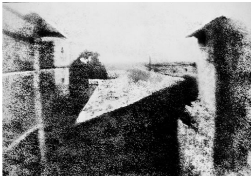
Figura: Primeira Fotografia do mundo. Joseph Nicéphore Niépce, 1826.